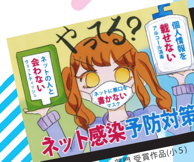
R3年度ポスター部門 受賞作品(小5)