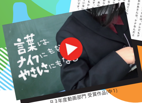
R3年度動画部門 受賞作品(中1)